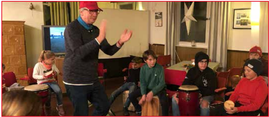
Weihnachtsfeier im SVR - 13.12.2022

Unsere Jugendarbeit blüht nicht nur dank unserer engagierten Trainer, sondern auch aufgrund der großartigen Unterstützung durch unsere hilfsbereiten Eltern. Diese stehen den Trainern stets zur Seite und tragen maßgeblich zum Erfolg unserer Programme bei. Die Unterstützung, die von vielen Seiten kommt, macht unsere Jugendarbeit zu etwas Besonderem.