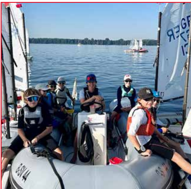
Karl-Lehmann-Regatta - 09./10.10.2023

wie hoch das Leistungsniveau der Teilnehmer war und wie souverän unsere jungen Segler damit umgingen. Dies zeugt nicht nur von ihrem Talent, sondern auch von ihrem unerschütterlichen Engagement für den Segelsport.