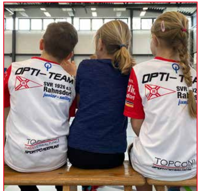
Athletikpokal - 25.02.2023

Besonders stolz sind wir auf unsere Trainingslager, die wir in den Oster- und Sommerferien organisieren. Hier haben unsere jungen Segler*innen die Möglichkeit, ihre Fähigkeiten weiterzuentwickeln und ihre Leidenschaft für den Segelsport zu vertiefen. Im vergangenen Sommer haben wir in Zusammenarbeit mit einem anderen Verein ein Trainingslager für fast 40 Kinder durchgeführt, was nicht nur zu einer wunderbaren Zusammenarbeit, sondern auch zu einem intensiven Erfahrungsaustausch führte.