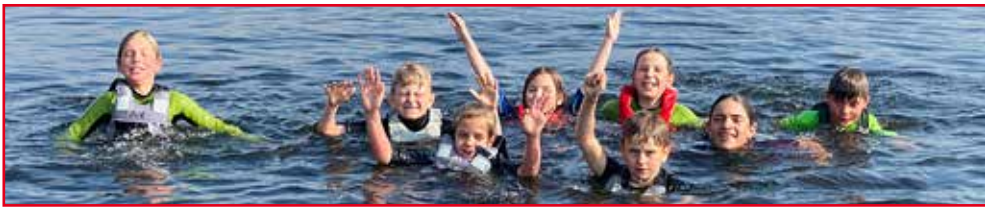
Training - Sommer 2023

In den letzten drei Jahren konnten wir unsere Jugendarbeit kontinuierlich ausbauen und erweitern. Mit einer kleinen Gruppe von etwa 20 jungen Seglern im Optimisten-Bereich gestartet, haben wir sie von ihren ersten Schritten auf dem Wasser bis zur beeindruckenden Teilnahme an der Deutschen Jüngstenmeisterschaft am Dümmer See in diesem Jahr begleitet. Einige unserer jugendlichen Mitglieder haben in dieser Zeit den Mut gefunden, andere Bootsklassen zu erkunden und sich der Herausforderung der Flatow-Schule zu stellen.