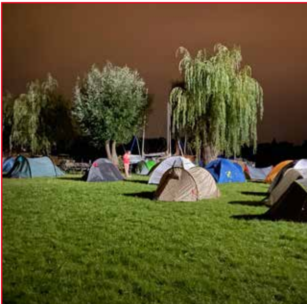
Übernachtung Trainingslager - Sommer 2023

Unsere Jugendarbeit blüht nicht nur dank unserer engagierten Trainer, sondern auch aufgrund der großartigen Unterstützung durch unsere hilfsbereiten Eltern. Diese stehen den Trainern stets zur Seite und tragen maßgeblich zum Erfolg unserer Programme bei. Die Unterstützung, die von vielen Seiten kommt, macht unsere Jugendarbeit zu etwas Besonderem.