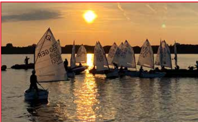
Revierregatta - 26.09.2023