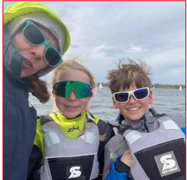
Trainingslager auf dem Müggelsee - Osterferien 2023

Wir sind fest davon überzeugt, dass unsere Jugendarbeit einzigartig ist und die Anerkennung durch den BSV eine hervorragende Möglichkeit bietet, dies zu würdigen. Mit Ihrer Unterstützung könnten wir unser Angebot noch weiter ausbauen und unseren jugendlichen Mitgliedern noch bessere Möglichkeiten bieten, ihrer Leidenschaft für den Segelsport nachzugehen. Weitere Informationen und Berichte über unsere